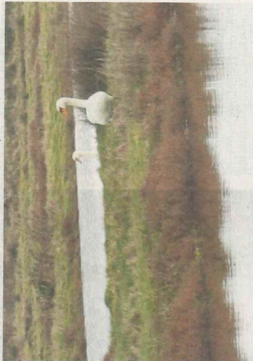
Ce nouveau parc régional devrait être intercommunal.