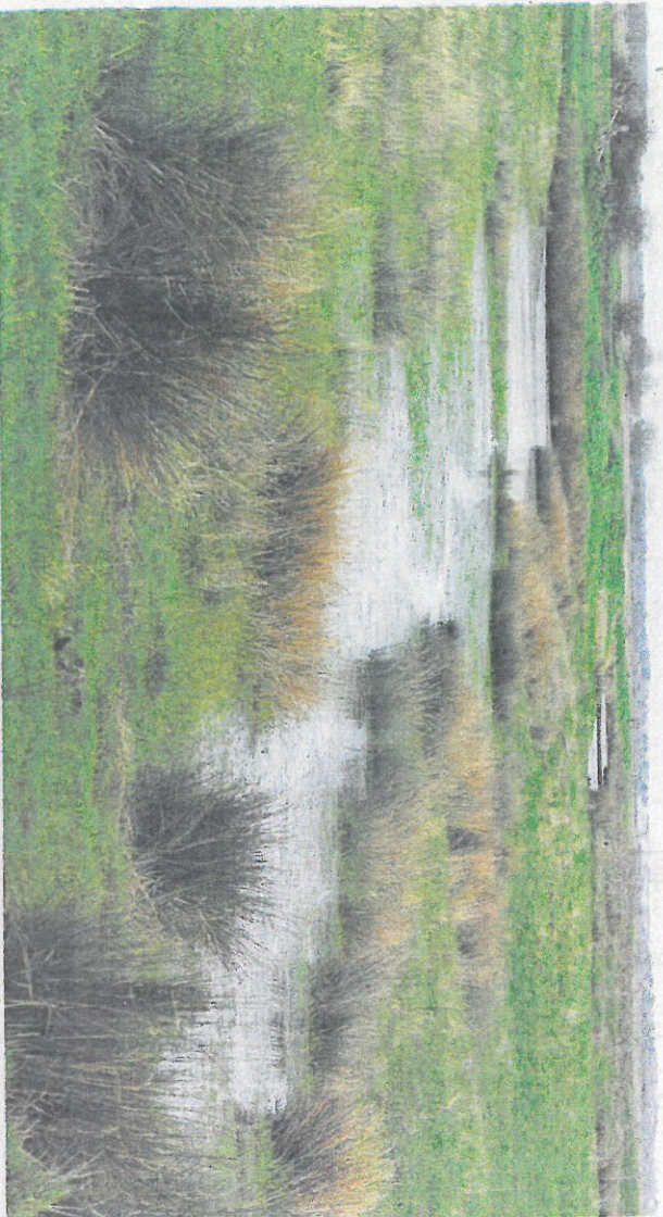
Principale zone humide du département, le marais de Brouage avec 12 000 hectares.

Lui y était d'ailleurs opposé à l'époque, et les deux démarches n'ont rien à voir puisqu'il ne s'agit pas, aujourd'hui, de limiter les usages. Encore fallait-il que cela soit compris par tout le monde: "Quand nous avons dit "banco", avec les présidents