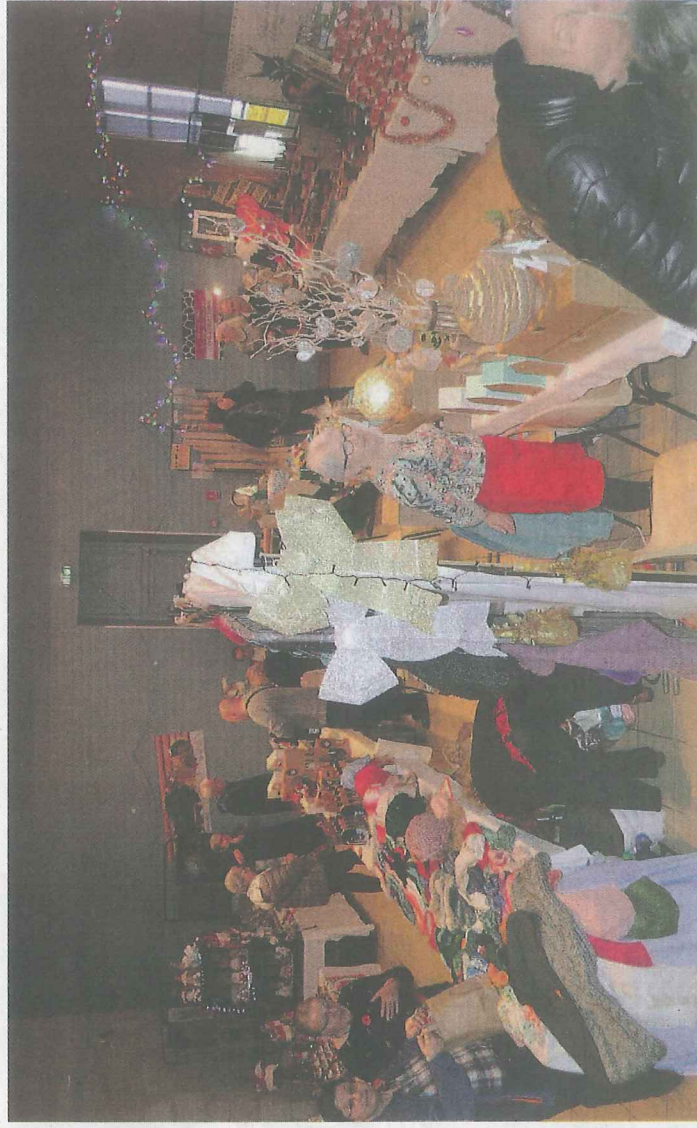
Il y en avait pour tous les goûts et toutes les bourses.

La prochaine animation aura lieu les 7 et 8 décembre de 13 à 18 heures. Ce sera un autre marché de ce type rue de la Grotte, pour célébrer le saint Nicolas. Les visiteurs qui portent ce prénom seront récompensés car : « Si tu t'appelles Nicolas, t'auras un chocolat ». ■