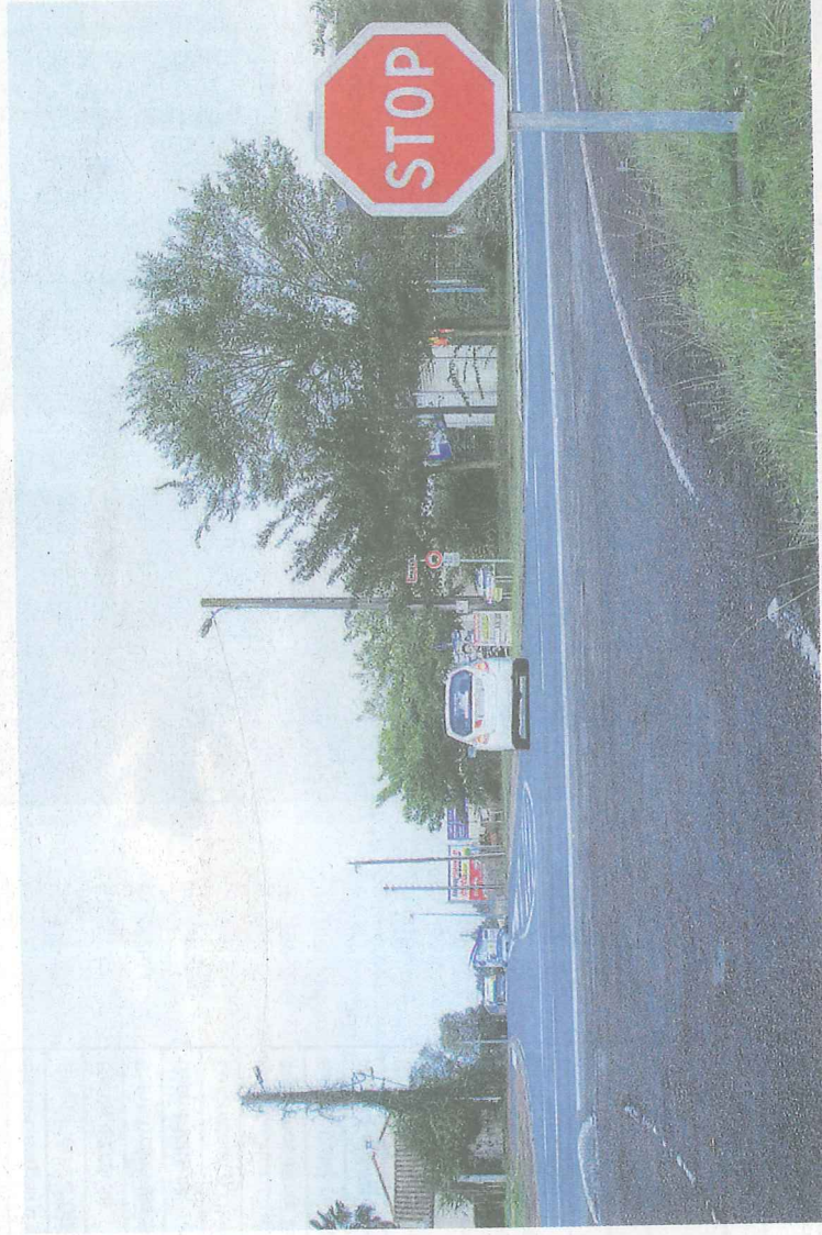
Les travaux du futur giratoire, au niveau de la rue du docteur roux, seront lancés début 2021. Inauguration avant l'été.

En direction d'Oléron ou en revenant du viaduc, cet aménagement doit aussi fluidifier les flux - et donc limiter les embouteillages - sur un axe qui voit défiler près de 40 000 véhicules par jour en été. La question de la suppression des deux tricolores au niveau de l'agence Orpi, sur l'entrée de ville principale, s'est posée au cours des