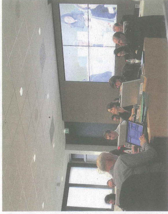
Le territoire du pays rochefortais s'engage dans la transition écologique.